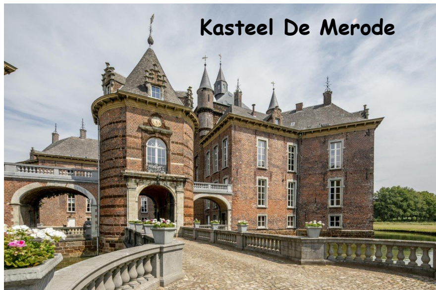
Kasteel De Merode

In de middag wordt een rondleiding gegeven in de Abdy en daarbij zal ook een bezoek worden gebracht aan het Da Vincimuseum, waar een replica van het Laatste Avondmaal als schilderij is te bewonderen. Het doek van 4,5 bij 9 meter is de meest getrouwe weergave (in de wereld) van de muurschildering van Leonardo da Vinci in Milaan, het fresco dat nu in verval is. Mogelijk dat we een rondleiding krijgen van een oud-inwoner van Wouwse Plantage: Kees van Heijst.