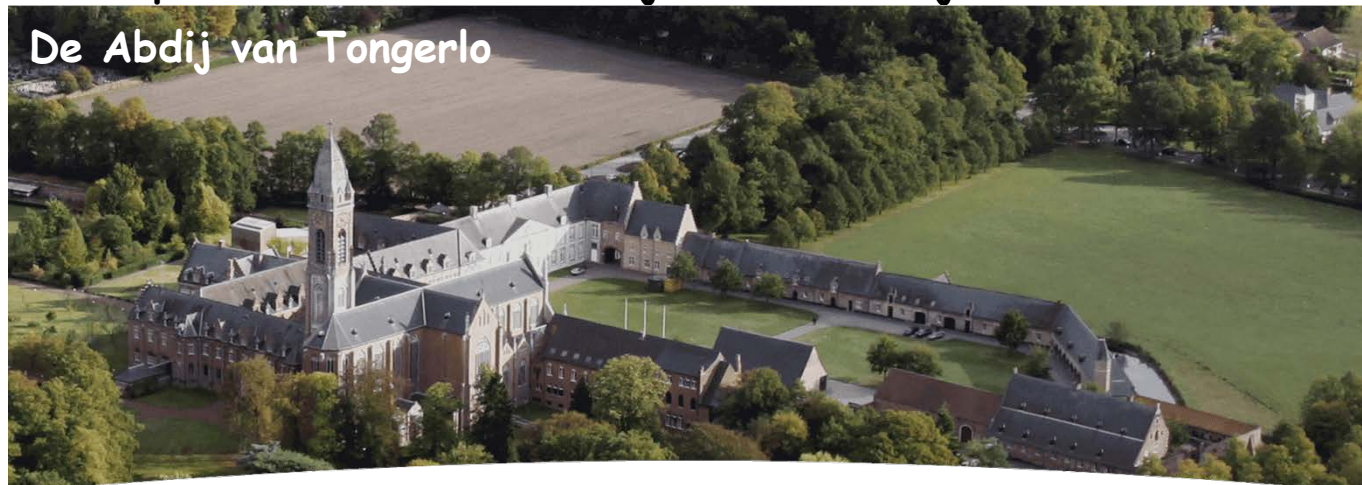
De Abdy van Tongerlo

18.00 uur. Al maanden geleden heb ik een optie op een bus genomen voor die datum, omdat alle excursies dit jaar zijn verplaatst van mei naar september en bussen moeilijk te boeken zijn.