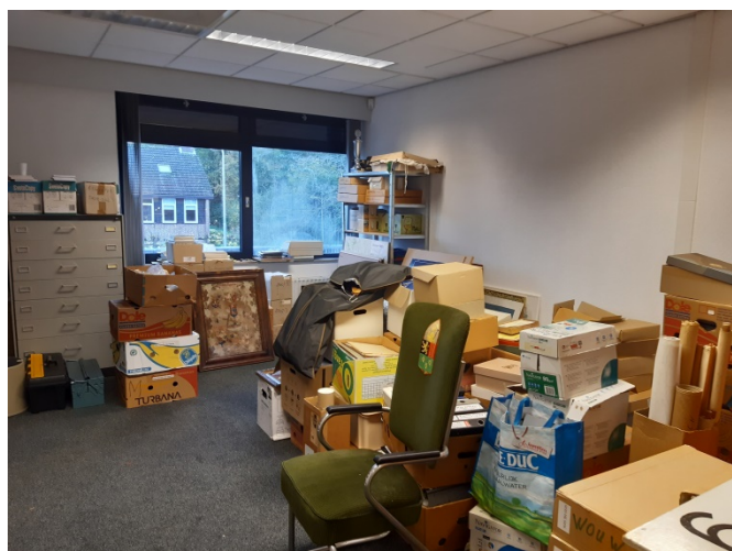
De andere spullen moeten nog uitgezocht en gesorteerd worden