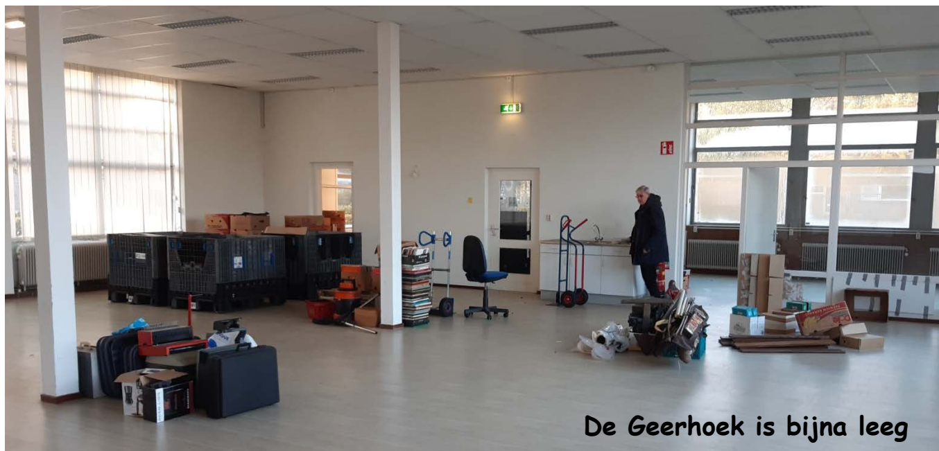
De Geerhoek is bijna leeg

Zoals u in het woordje van onze voorzitter kon lezen, ging die snel aan de slag om onderdak te vinden. En met succes; we konden verhuizen naar enkele ruimtes bij buurlocatie Univé. Zij het dat dit ook tijdelijk is, want het gebouw krijgt een andere bestemming.