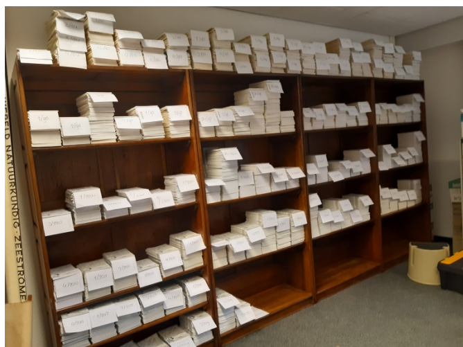
Onze eigen tijdschriften keurig op jaargang in de kasten

Bij Univé regelde Adriëne samen met Manon en 's middags ook Ellen dat alles op de juiste plaats terecht kwam.